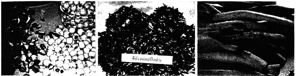
เมล็ดบัว